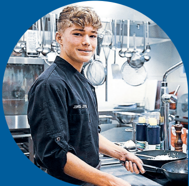
Jan Näf Raiffeisenbank Regio Uzwil

erweiterst deinen Horizont. Der befristete Wechsel in eine unbekannte Branche oder sogar einen anderen Beruf ermöglicht es dir, neue Aufgabenstellungen und Prozesse, aber auch Unternehmenskulturen kennen zu lernen.