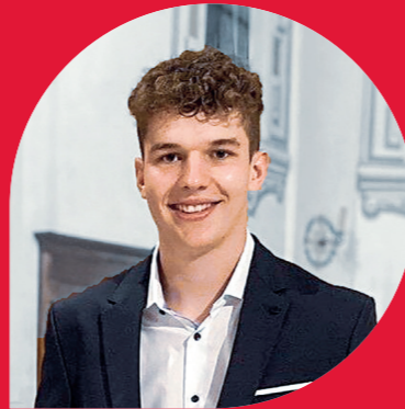
Etienne Jung Bühler AG

des Projektes wirst du in Disziplinen wie Projektmanagement, Web-Design, Präsentationstechnik etc. geschult. Ein Coach betreut und unterstützt euch während des gesamten Prozesses.